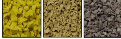
Yellow 83 Earth Yellow 88 Brown 89