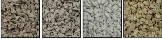
Beige 93 Eggshell 94 White 95 Cream 98