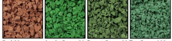
Red 80 Apple Green 91 Forest Green 90 Tea Green 108