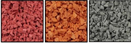
Bright Red 96 Bright Orange 104 Grey 82